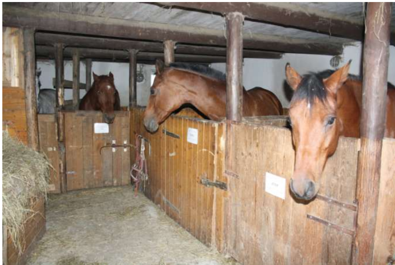
Stáje pro koně Eva Nohelová